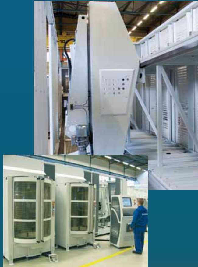
人間工学に基づいたローディングステーションがパレットセンタへの容易なアクセスを可能にします