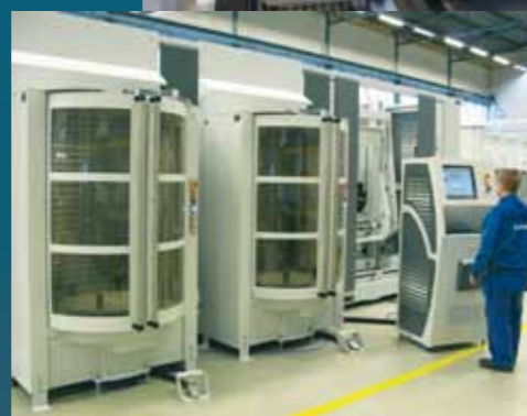
Stazioni di carico ergonomiche assicurano un facile accesso al pallet.