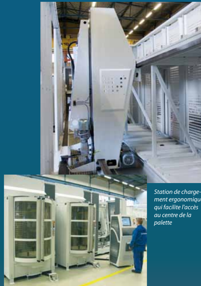
Station de chargement ergonomique qui facilite l'accès au centre de la palette