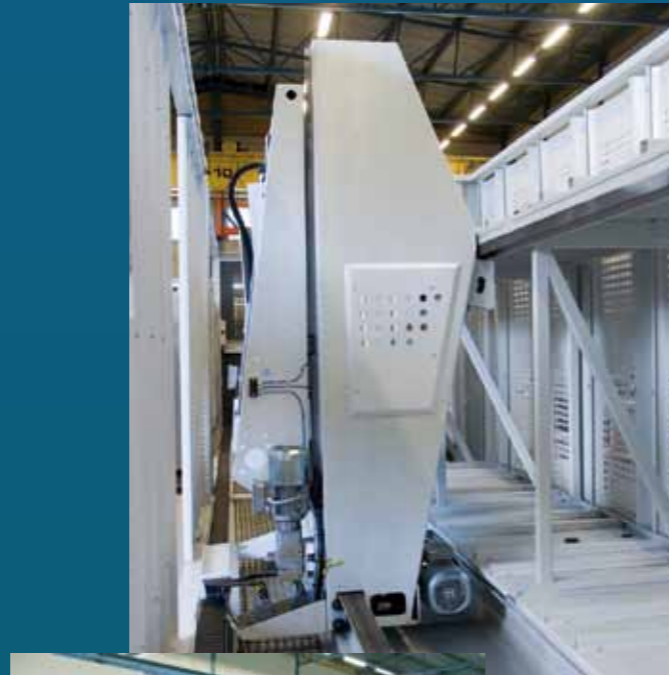
La estación de carga ergonómica garantiza un fácil acceso al centro de los palets